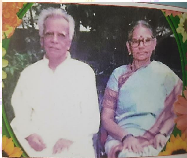
... ౧౦౯ ఉంది