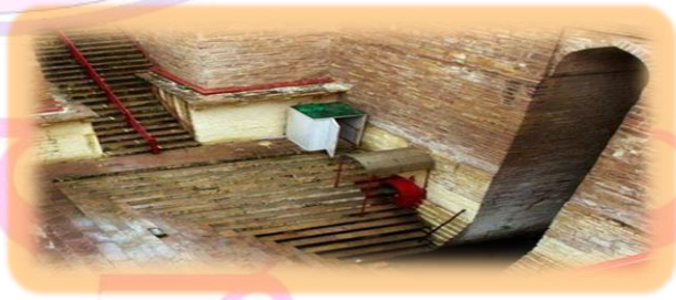
... ఇంకా ఉంది

చేయు వారి ఏడు జన్మల పాపం తొలగిపోతుంది. ప్రతి ఆదివారం ఏ వ్యక్తి అయితే పవిత్రముగా లోలార్కు పాదోదక పానం చేస్తారో వారికి దద్రు, విచల్వక వంటి భయంకరమైన చర్మ రోగములు దలచేరవు, అంతే కాదు ఇహలోకం లో ఎటువంటి బాధలు కలుగవు. కాశీలో ఉంటూ కూడా లోలార్కు ఆదిత్యుడిని దర్శించకుండా ఉంటారో వారు సదా ఆకలి, రోగములతో పీడింపబడతారు. లోలార్కు తీర్థము కాశీలోని సమస్త తీర్థములకు మకుటాయమానమైన తీర్థము. భూమండలంలో ఏ తీర్థమైన అసీసంగమ తీర్థము గొప్పదనము లో పదునారవ వంతు భాగముతో కూడా సమానం కాదు. సమస్త తీర్థములలో స్నానం చేస్తే కలిగే ఫలితం కేవలం ఈ సంగమము లో స్నానం చేస్తే సిద్ధిస్తుంది. ఇది స్తుతి కాదు సత్యము. విశ్వనాథుడు, గంగ, సూర్యుడు ఉన్నట్టి ఈ పరమ పుణ్యక్షేత్రమును బుద్ధిహీనులు మాత్రమే విశ్వసించరు. కాశీ మహిమ అర్థరహితము అని భావించువారు అనేక జన్మలు క్రిములై ముక్తిని పొందలేరు. లోలార్కు మహిమను తెలుసుకున్న వారు ఎటువంటి బాధలను పొందరు. కాశీలో లోలార్కు ఆదిత్యుడి మందిరం లోలార్కు కుండం, తులసీ ఘట్టం వద్ద ఉన్నది. లోలార్కు కుండంలో భక్తులు స్నానానంతరము లోలార్కు ఆదిత్యుడిని, లోలార్కు వినాయకుడిని దర్శనం చేసుకోవచ్చు. భక్తులు పడవ లో తులసీ ఘట్టం వరకు చేరుకొని మెట్ల మార్గం ద్వారా కూడా లోలార్కు కుండం చేరుకోవచ్చు.